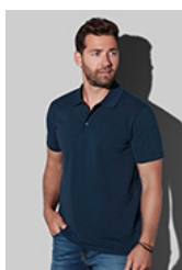
ST9060 Lux Polo